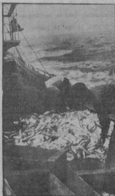
La tripulación selecciona el pescado, todavía vivo, antes de trasladarlo a las cámaras frigoríficas, donde se conserva—aliado de la gula—hasta llegar al puerto.

Al proletariado del mar todavía no se le ha descubierto. Son ingenuos, y conmovedores para ciertas sensibilidades, los bocetos afiligranados, retocados y escrupulosos del siglo pasado, en los que se quería dar al espectador o al lector una noción de la existencia y psicología de los trabajadores del mar. Hace falta que entre estos hombres