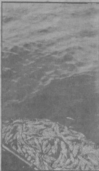
Fauna marina, plateada y viva, en la red, antes de ser destripada por las manos hábiles de los pescadores, mineros en las minas de los mares del Norte.

Millas y millas para llegar. Millas y millas para volver. Agua y cielo. Car-