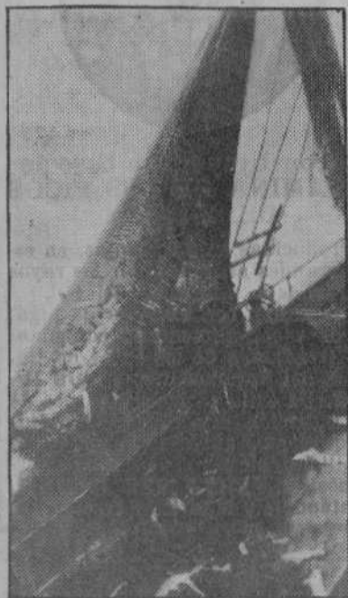
El copo, repleto de pesca, es izado a bordo, mientras la mar gruesa se divierte con el barco...