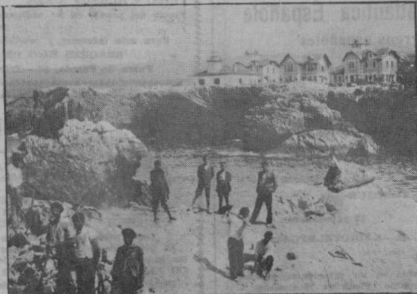
Llanes tiene rincones de una insuperable belleza...

Después de oír de personas tan documentadas en estos asuntos tales afirmaciones; luego de observar que, efectivamente, el de Llanes es modelo de partidos judiciales; después de convivir unos días entre estas buenas y atentas gentes llaniscas, sólo nos resta de