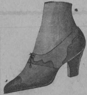
De buena piel de color, a 12 ptas.