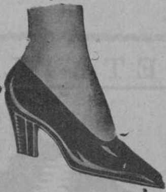
De charol, a 15 pesetas

¿Quién vende el calzado más barato en Santander? ¿Quién vende el mejor calzado?