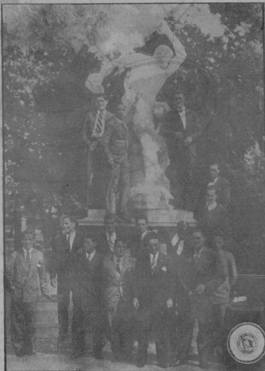
CABALLEROS DEL DEPORTE.—Las reglas del deporte exigen fortuna de sencillez para ganar, y elegancia para perder... Nuestros jugadores—los "équipers" del Racing—han ganado y perdido en París, como prescriben reglas tan antiguas como la civilización clásica... Los santanderinos, poco después del triunfo, se reunieron—he aquí al grupo—en torno y encima de una figura atlética tallada en mármol... Sonríen, como caballeros del deporte...