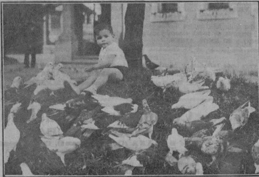
Un momento de estampa lírica de Andersen en ese jardín urbano, colindante de los muelles, que Santander posee en su corazón de ciudad... Las palomas cercan, confiadas y amorosas, al niño...