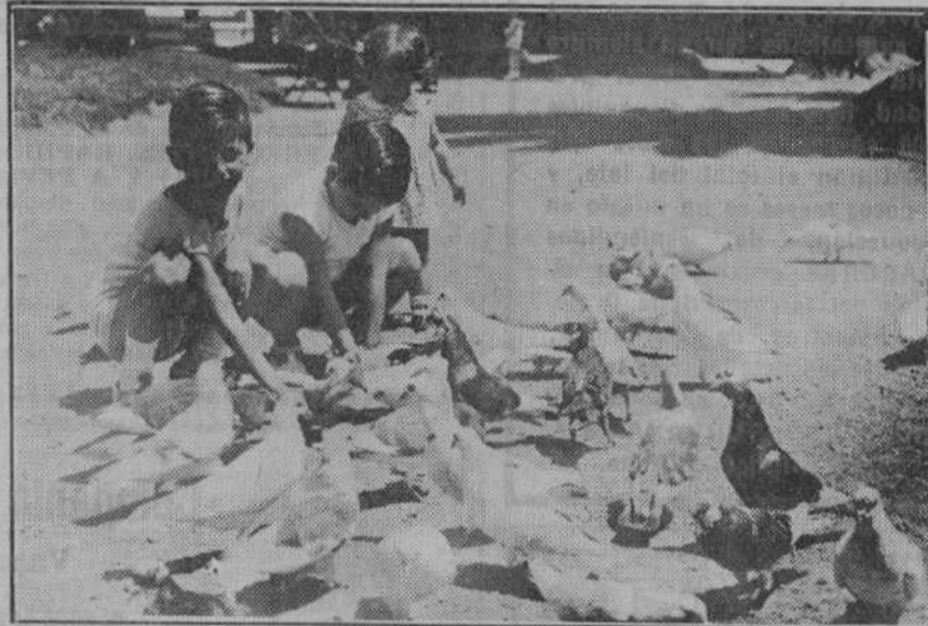
Dando de comer a los pájaros de Dios, bonitos y mansos, a los que la sabiduría popular confiere la representación total de la pureza de espíritu e instinto... (F.º Alejandro.)

posible dar dulzura a los gestos y a los sentimientos.