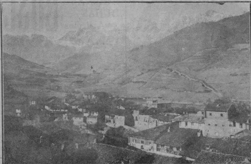
Liébana con el airón blanco y negro de los Picos...

TALLERES TIPOGRAFICOS DE LA «EDITORIAL MONTANESA». CALLE DE SAN JOSE, NUM. 1º