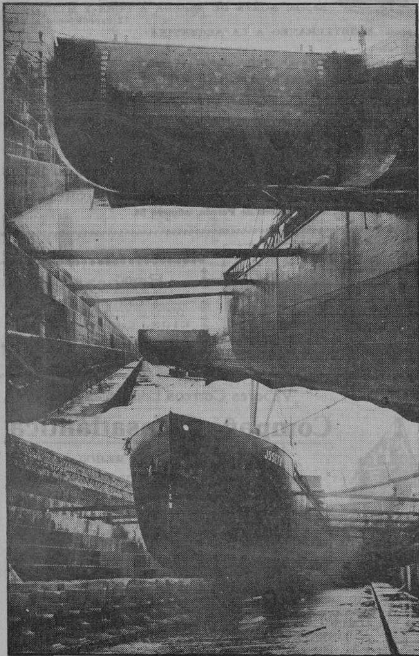
Tres vistas, originales, del burladero del Océano.