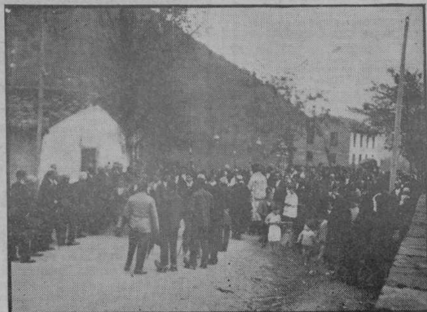
La procesión de “La Santuca” al llegar a Potes.

Cantar suave de campanillas de plata. Muchas campanillas de plata en el trono de la Santuca. Su capa tiene hilos de oro y su cabecita es de alabastro. Ya asoma en la puerta de la iglesia entre las cruces y los ciriales. Una transición profunda de silencio interrumpido por el llanto de algún viejo hincado en la tierra. Son las seis de la mañana cuando la larga comitiva se pone en marcha. En el camino susurra la letanía el son de las campanillas. Una letanía melancólica, dolorosa que comienza en Aniezo y termina en el monasterio de Santo Toribio para luego volver a empezar. Nosotros seguimos a esta procesión, camino de Frama, llenos de sueño y de cansancio. Los jóvenes se relevan en las andas pintadas, cada pocos minutos. En honor para