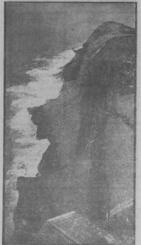
Desde lo alto, el mar pone cenefa de encaje en la costa brava.

Lo único abrumador para el torrero es la soledad. Un hombre misántropo por naturaleza, no sentirá, seguramente, la misma desolación espiritual que estos antiguos trabajadores del mar, a los que las tempestades de la vida y la