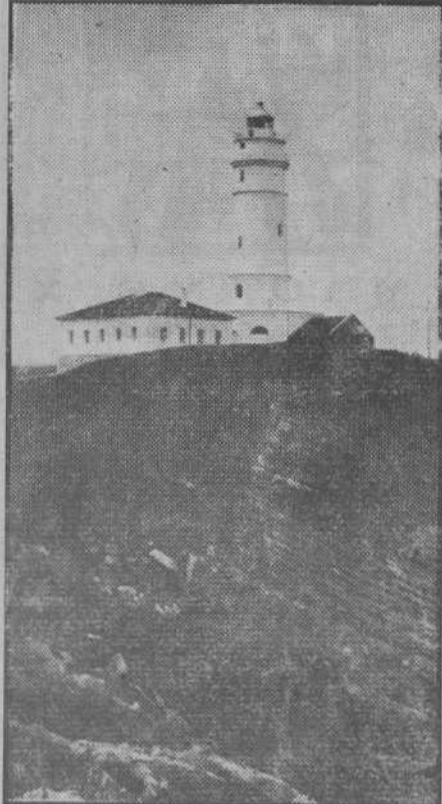
Arriba, en la cúpula del faro, está el gran monóculo nocturno.