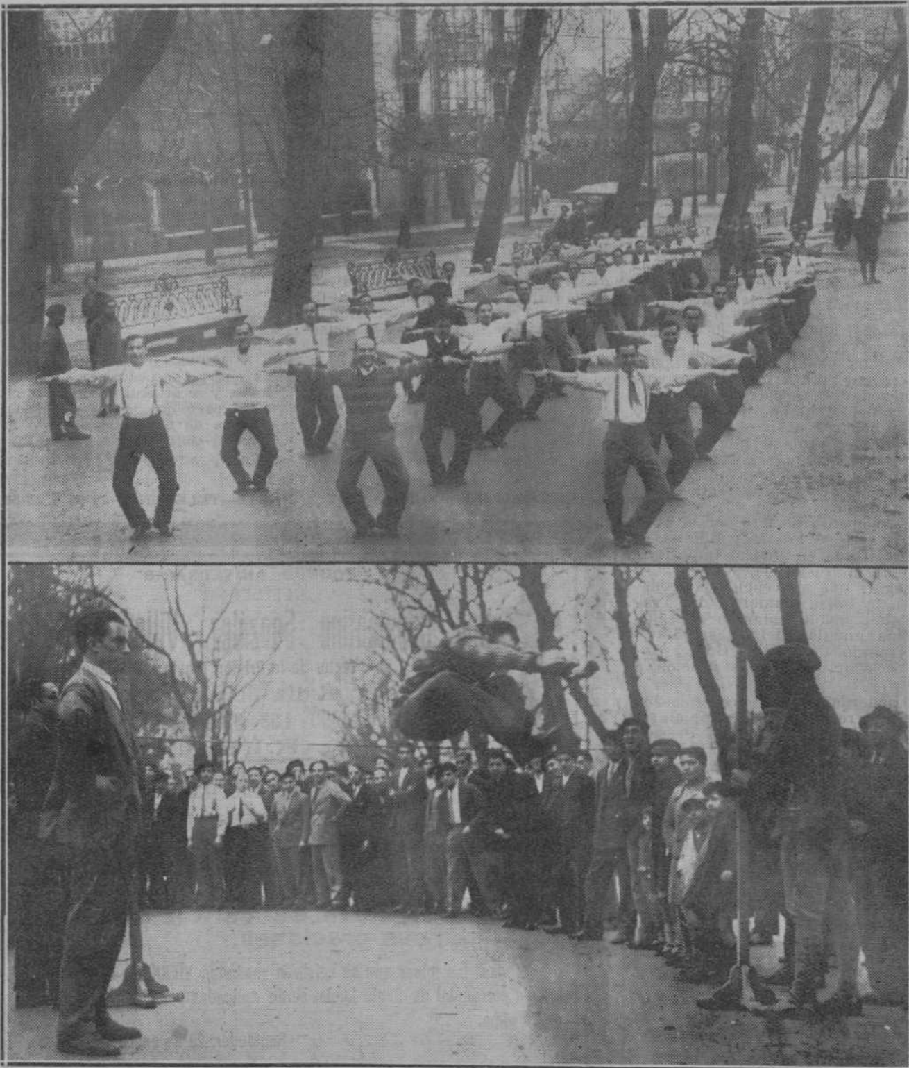
Ejercicios de educación física por los reclutas del servicio reducido, de la Escuela Militar de Tiro de Santander, que dentro de poco ingresarán en filas.

Advertimos a los señores que nos favorecen con el envío de originales que no hemos solicitado, que nos es imposible mantener correspondencia acerca de ellos.