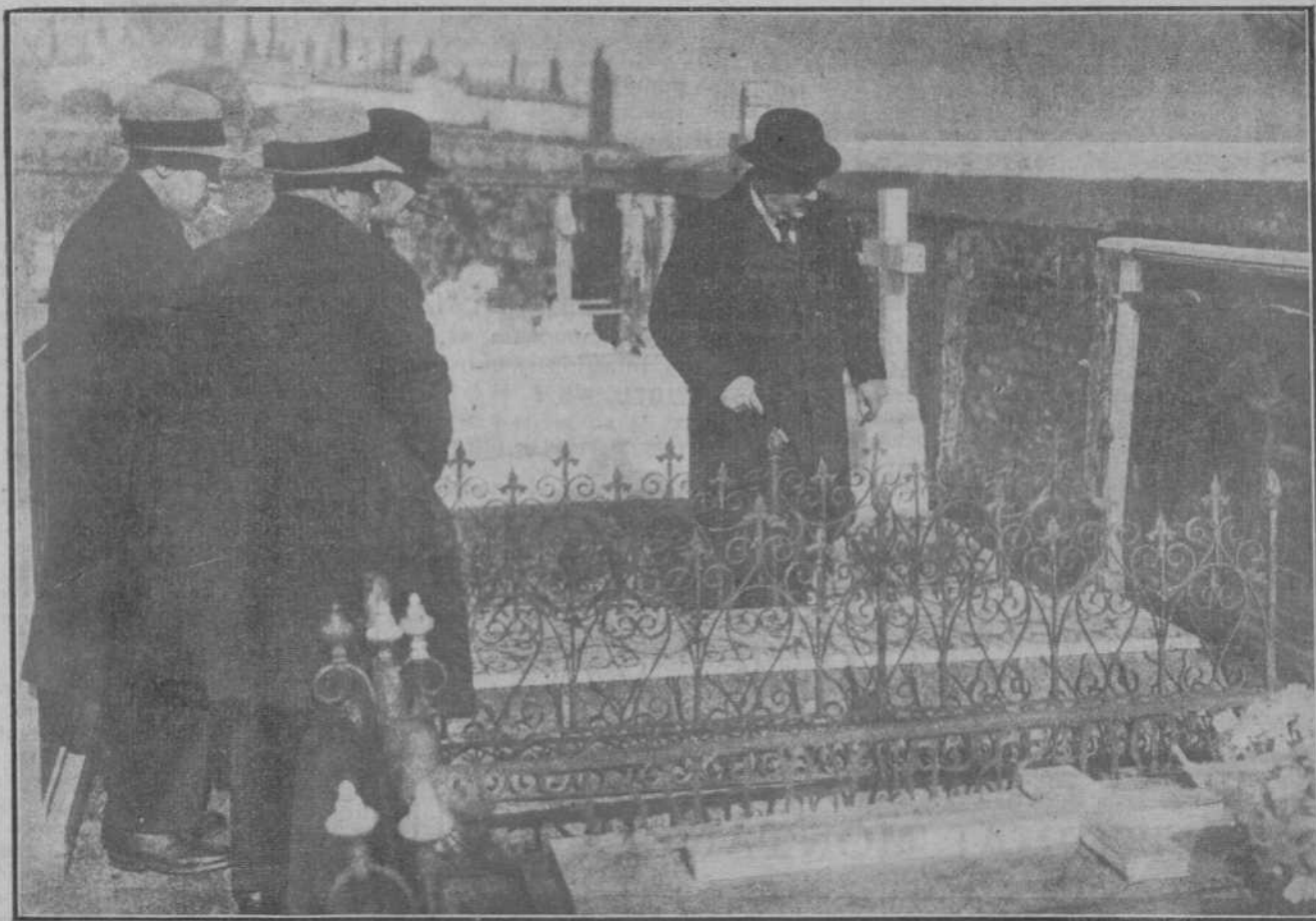
MADRID.—El gobernador civil y los periodistas, con quienes visitó en el cementerio de San Isidro la modesta tumba del eminente hombre público del pasado siglo don Emilio Castelar y a quienes expuso su plausible iniciativa de gestionar el traslado de sus restos al panteón de hombres ilustres, donde legítimamente deben reposar.

Advertimos a los señores que nos favorecen con el envío de originales que no hemos solicitado que nos es imposible mantener correspondencia acerca de ellos.