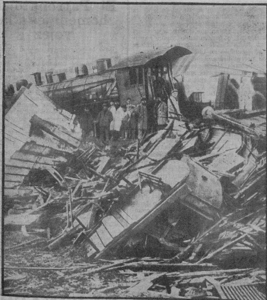
CATASTROFE FERROVIARIA.—LEON.—Un detalle del expreso de Asturias al chocar con un mercancías en Cuadros.