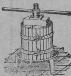
Prensas para uva manzana desde 50 º 1

ALQUILO piso amueblado, una mansarda y hotelito. Doctor Madrazo, 2.