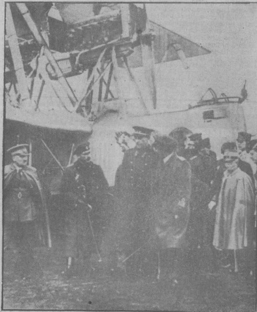
ROMA.—Los Reyes Víctor Manuel, de Italia, y Alberto, de Bélgica, y los príncipes extranjeros invitados a la boda del heredero del trono, durante su visita al aeródromo de Ciampino, donde se celebró una grandiosa manifestación de las fuerzas aéreas italianas.

El botín tiene, por su procedimiento, más de novela rusa que La Venus mecánica . Nos da toda la vida de un hombre, desde su infancia, hasta los tiem-