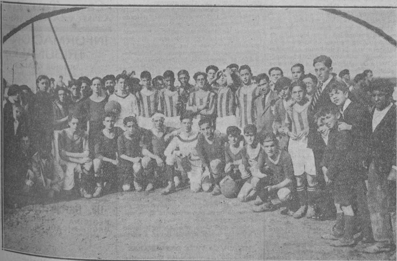
EL FUTBOL DE LOS CLUBS MODESTOS.—En la presente foto, los aficionados pueden ver a los valientes muchachos del equipo «Tolosa», que ganó la copa de su serie en el Torneo Santiuste.