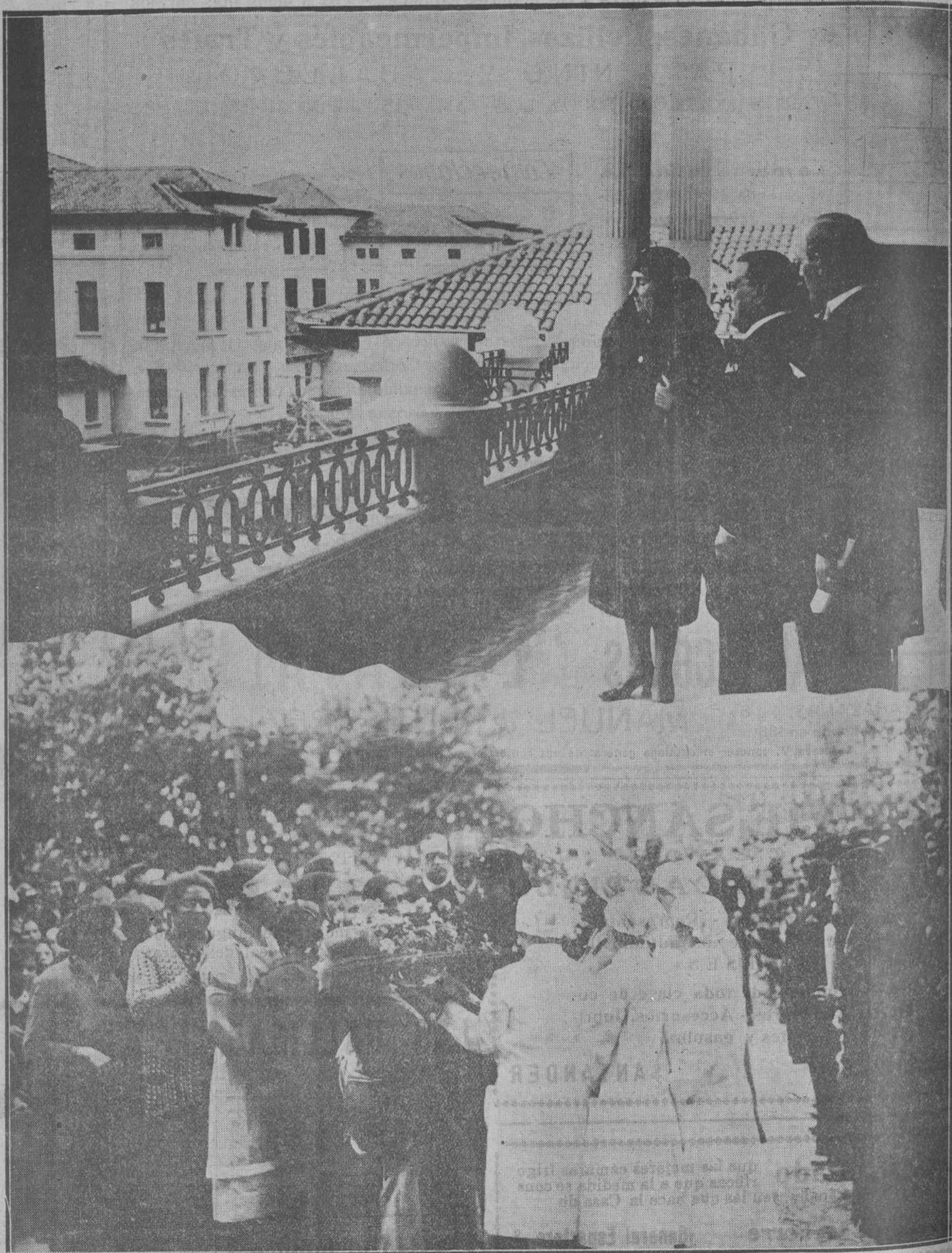
DE LA INAUGURACION DE LA CASA DE SALUD VALDECILLA.—La marquesa de Pelayo, con el ministro de la Gobernación, contemplan desde la terraza de uno de los pabellones la obra colosal del insigne filántropo.—Doña María Luisa Pelayo fué objeto de grandes muestras de cariño por parte de las clases populares...

LEA USTED NUESTRA AMPLIA INFORMACION TELEFONICA