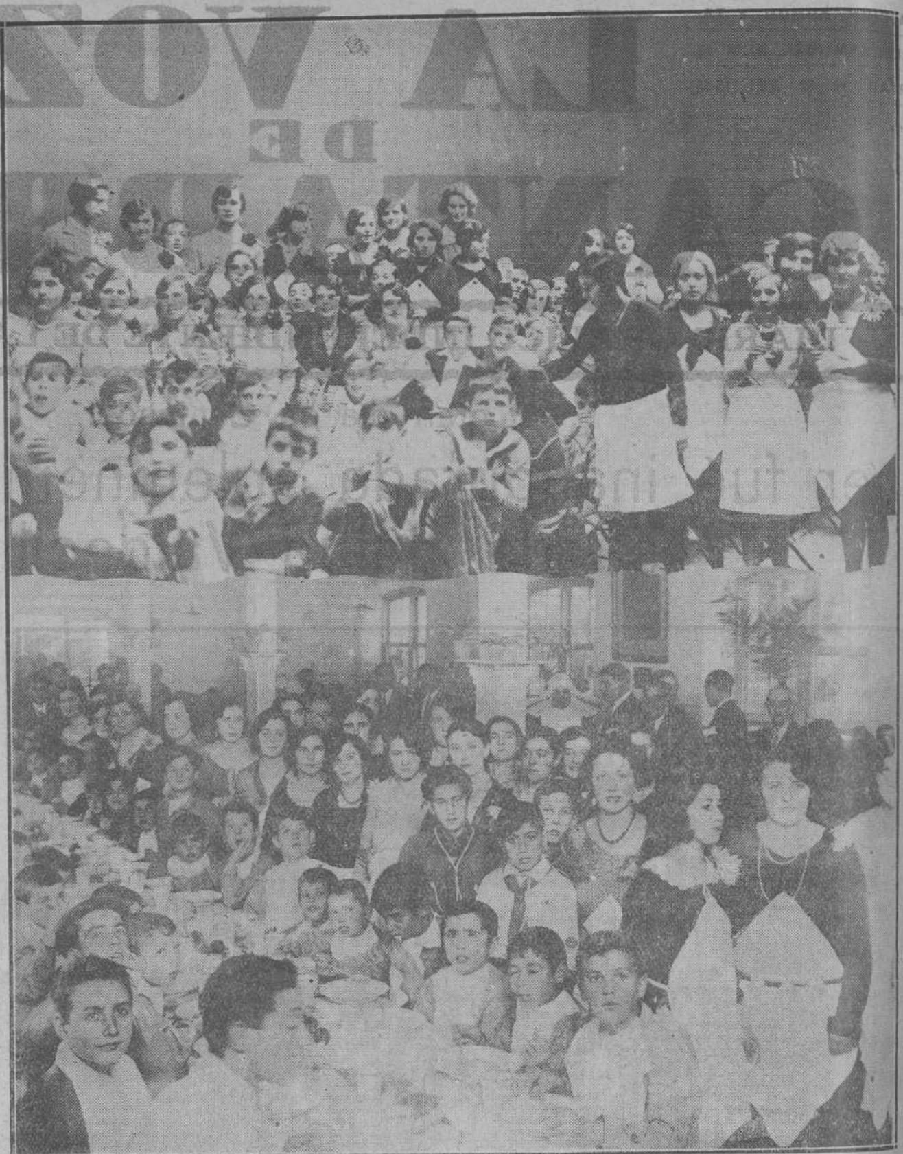
DESPUES DE LA INAUGURACION.—Niñas jóvenes santanderinas sirvieron las comidas con que fueron obsequiados los niños en la Casa de Caridad y en el Frontón.

En el hall a que antes aludimos se hicieron entrega a la marquesa de Pelayo de varias placas entre ellas tres con dedicatorias sentidísimas de los obreros del nuevo Hospital, cigarrerías de Santander y pescaderas. También se entregaron varias canastillas de flores sobresaliendo por su preciosidad las de los obreros del Muelle, costureras, Comisión del homenaje al marqués de Valdecilla, en-