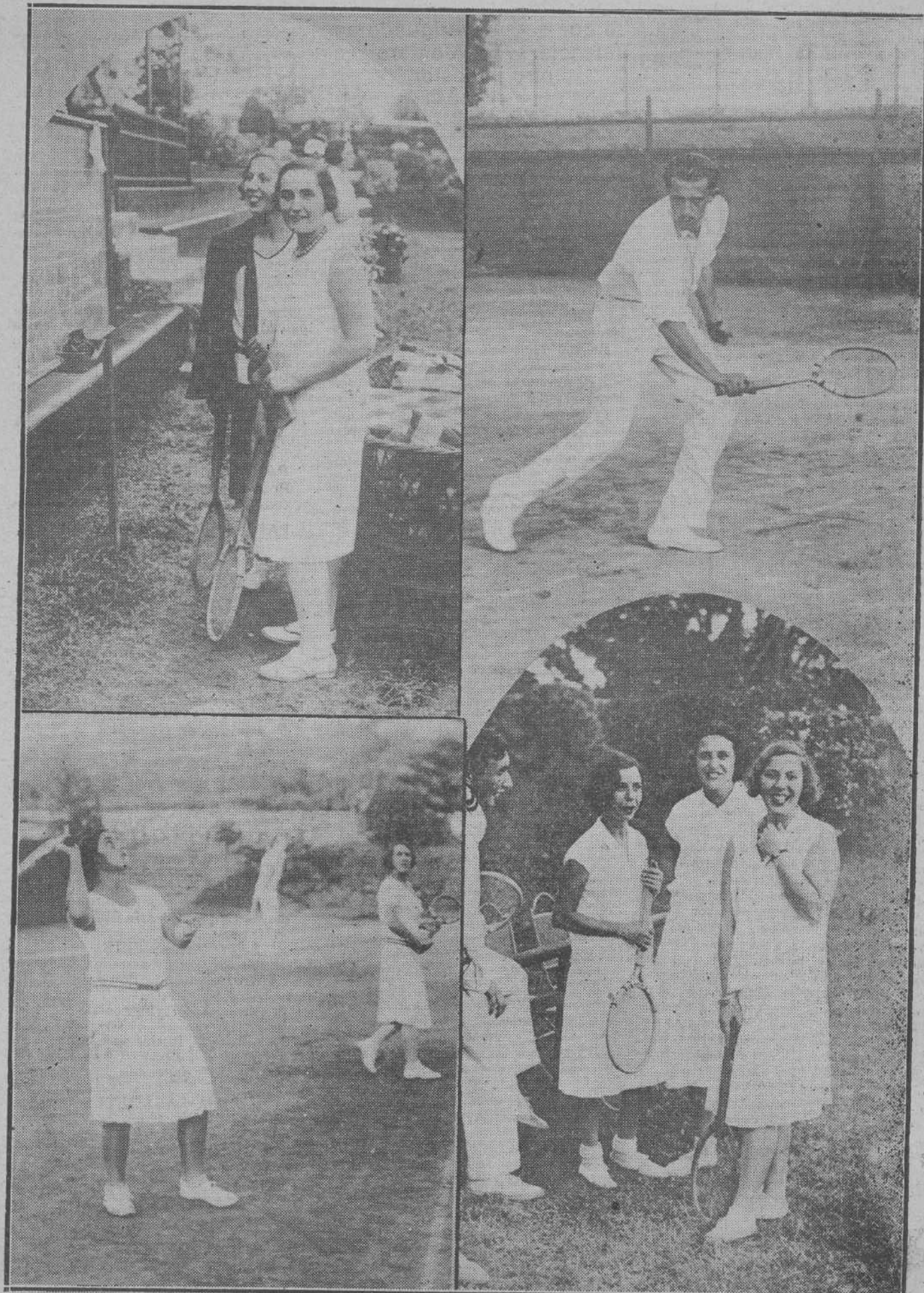
LAS TARDES DEL TENNIS.—Ante las pizarras de inscripciones.—El infante don Jaime en una jugada.—Una bella señorita en un momento de un partido.—Tennistas guapas en un descanso.