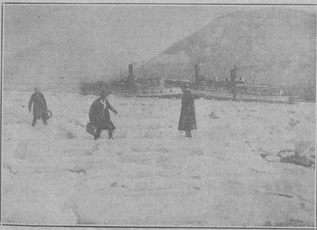
EL FRIO EN NORTEAMERICA. —Interesante fotografía del río Hudson helado en Newburg. En la fotografía aparecen tres barcos apri signados por el hielo.

LEA USTED EN NUESTRAS PLANAS DE INFORMACION TELEFONICA LAS ULTIMAS NOTICIAS DE ESPAÑA Y EL