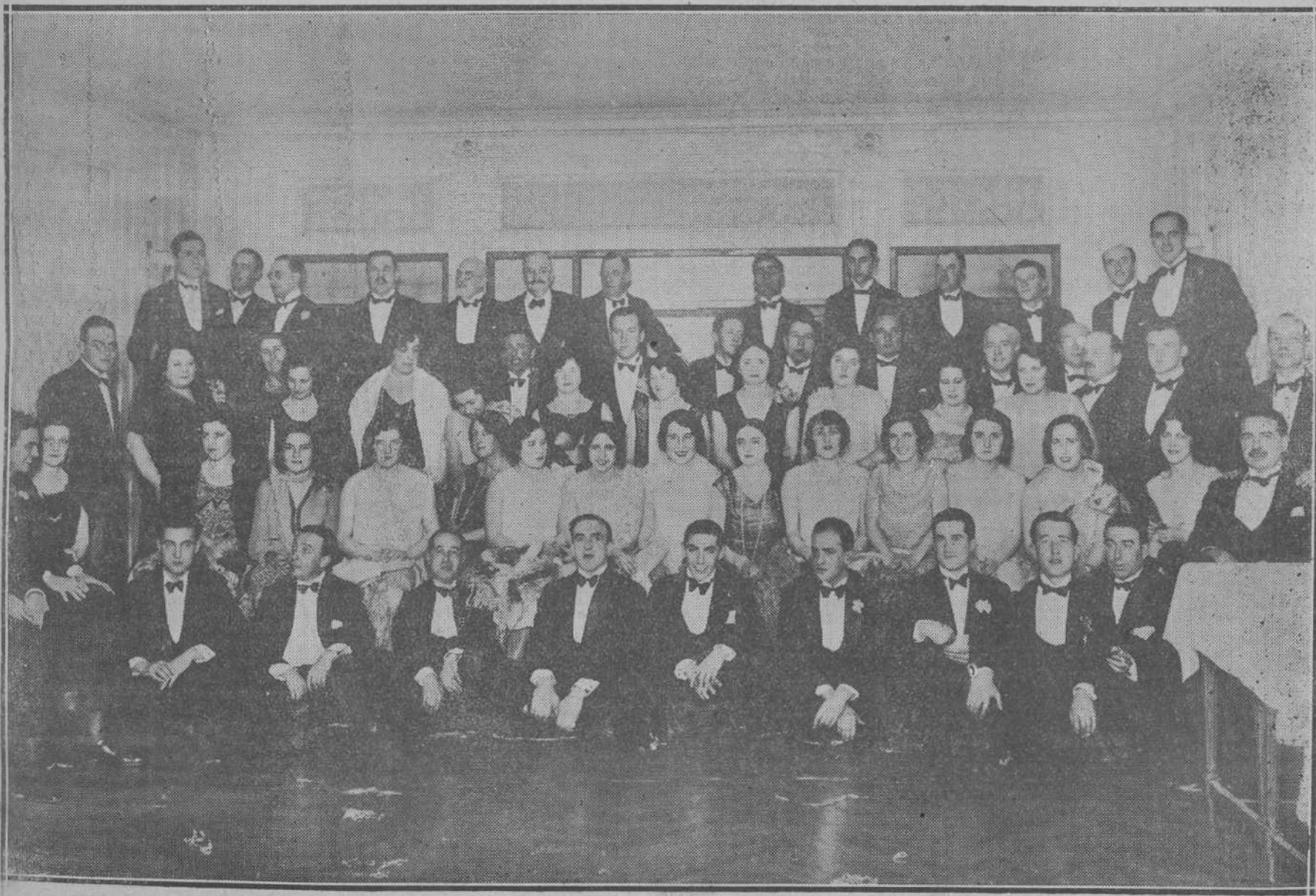
EL BAILE-CENA DEL ROTARY CLUB.—Para festejar el principio del año dió el Rotary Club una animada fiesta en el salón rojo de Royalty.—Un grupo de los concurrentes.