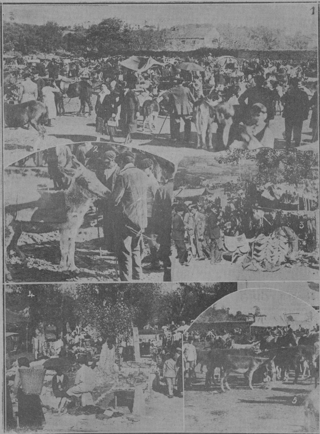
VARIAS E INTERESANTES NOTAS DE LA FERIA DE SAN LUCAS QUE SE CELEBRÓ AYER EN HOZNAYO.