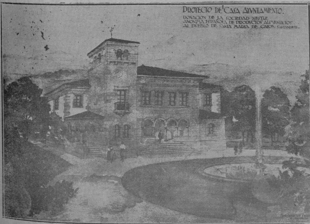
Proyecto de la Casa Ayuntamiento del pueblo de Santa María de Cayón, que ha de construirse a expensas de la fábrica de La Penilla.