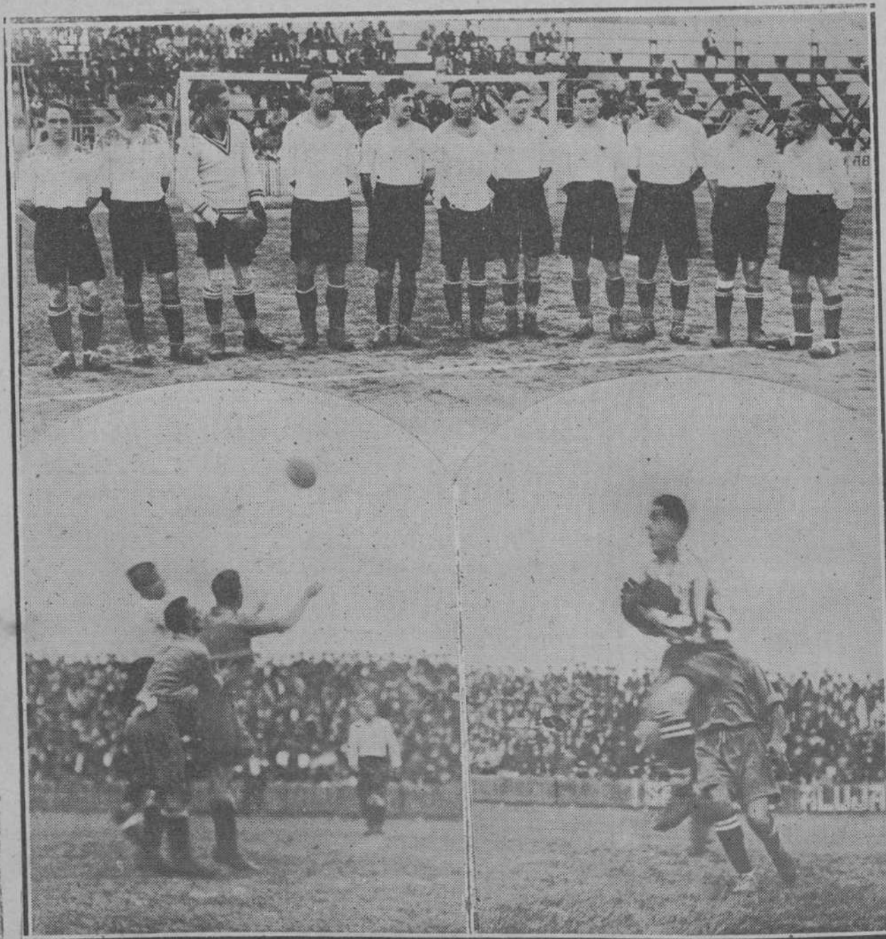
El domingo presentó el Racing contra el Atlético, de Madrid, y que triunfó por cuatro a dos en dicho partido. (Fotos ALEJANDRO).

La fecha de este acto es la de hoy, martes, a las ocho de la noche, y al mismo asistirá una representación de nuestra Diputación provincial. Por exigencias del local se ruega a los señores socios se abstengan de concurrir acompañados de personas extrañas al Ateneo.