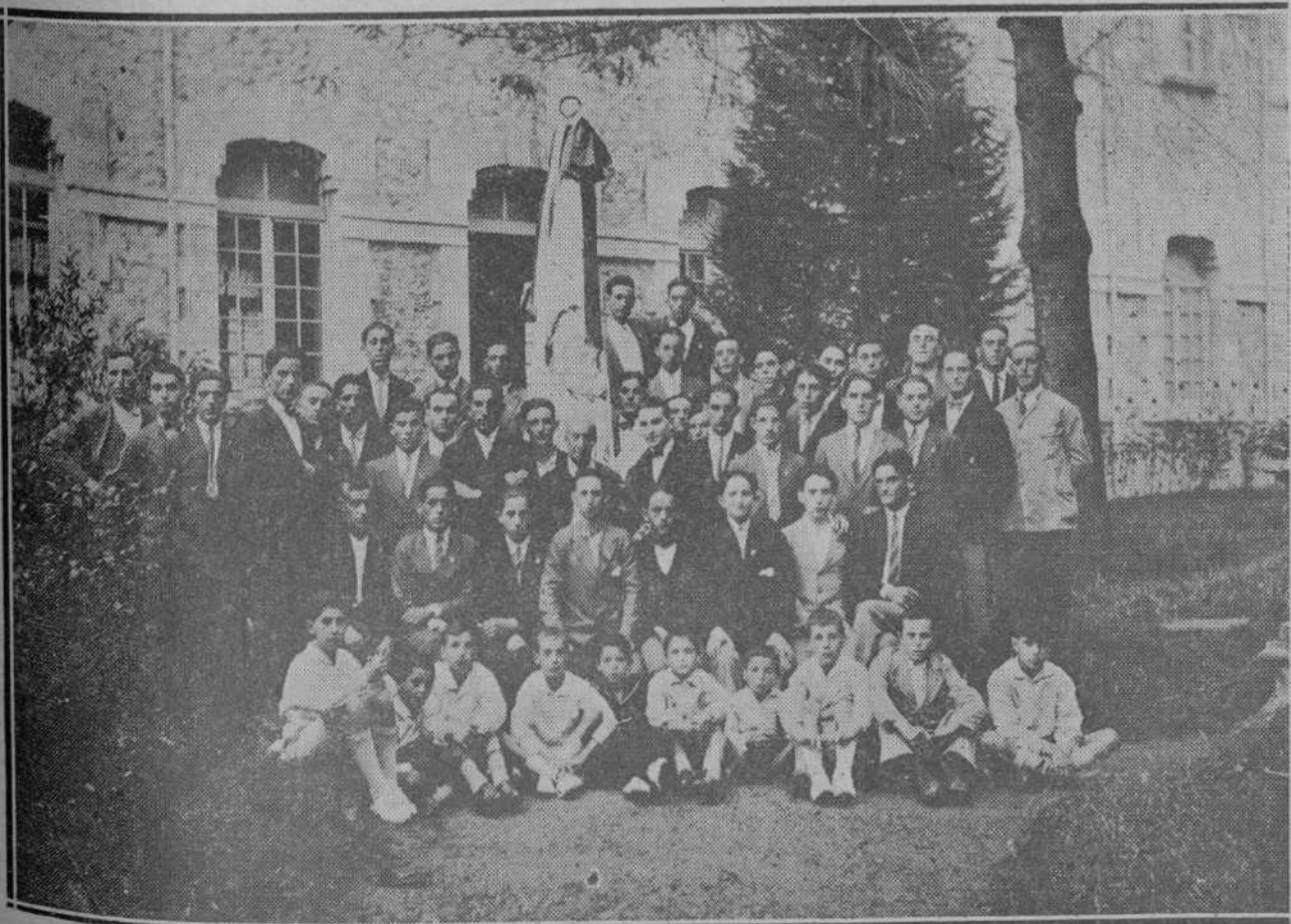
El Orfeón Torrelaveguense que, con motivo de cumplirse ayer el cuarto aniversario de su fundación, cantó una solemne misa en la capilla de los Sagrados Corazones.

La velada del domingo tuvo que suspenderse a poco de empezada por la torrencial lluvia que cayó.