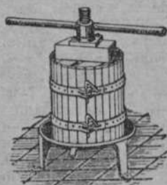
Prensas para uva y manzana desde 50'.

HOTEL SUIZA (Sardinero). Se alquilan pisos muy económicos. Informarán en el mismo.