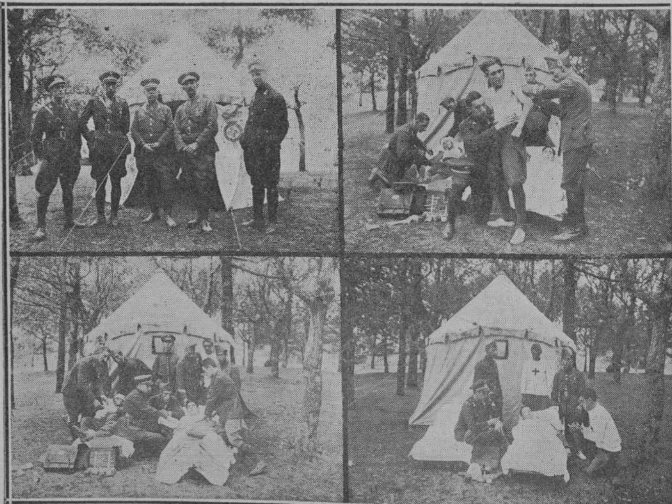
Los jefes y subalternos de la Cruz Roja de Santander haciendo interesantes prácticas en un delicioso rincón de la provincia.

alentado por los éxitos obtenidos por sus alumnos en los pasados cursos, y de un modo particular en el último, el Ateneo Popular ha pensado en aumentar sus enseñanzas y dar mayor amplitud a las establecidas. Para ello, desde el próximo día quedará abierta la matrícula de las siguientes clases: Taquigrafía, Mecanografía, Dibujo lineal, de figuras y artístico; Inglés, primero y segundo curso; Aritmética mercantil, Teneduría de libros, Ampliación de Estudios Primarios y Esperanto.