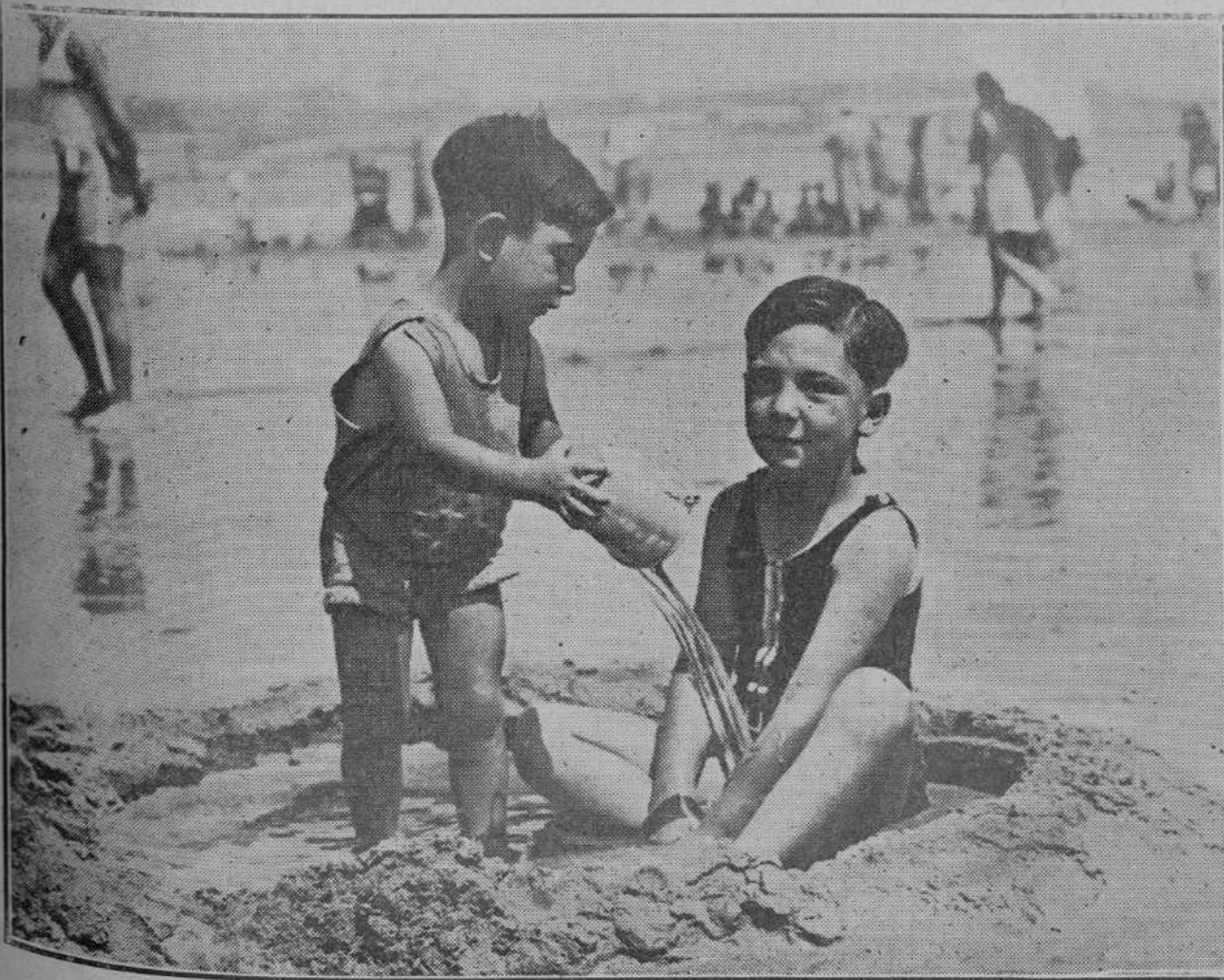
ESCENAS DE LA PLAYA.