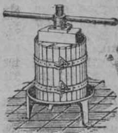
Prensas para uva y manzana desde 50 % 2.

MEDICO alquila casita o piso amueblado, próximo Torrelavega, Cavada, Liérganes. Frutería calle Remedios.