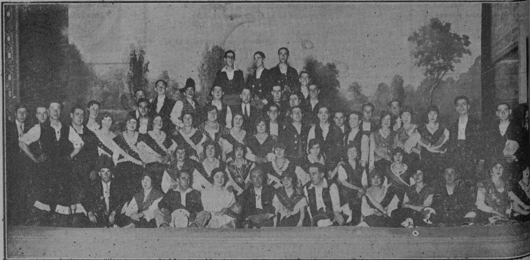
DE UNA FUNCION TEATRAL.—Bellas señoritas y simpáticos muchachos que el sábado último interpretaron admirablemente en Pereda la magnífica ópera "Maruxa". (Foto ALEJANDRO).

Los médicos de guardia le aplicaron una herida contusa en el pecho izquierdo, contusión erosiva en la nuca, erosiones en la cara, contusión en la región occipital y ligera conmoción cerebral. Pronóstico reservado.