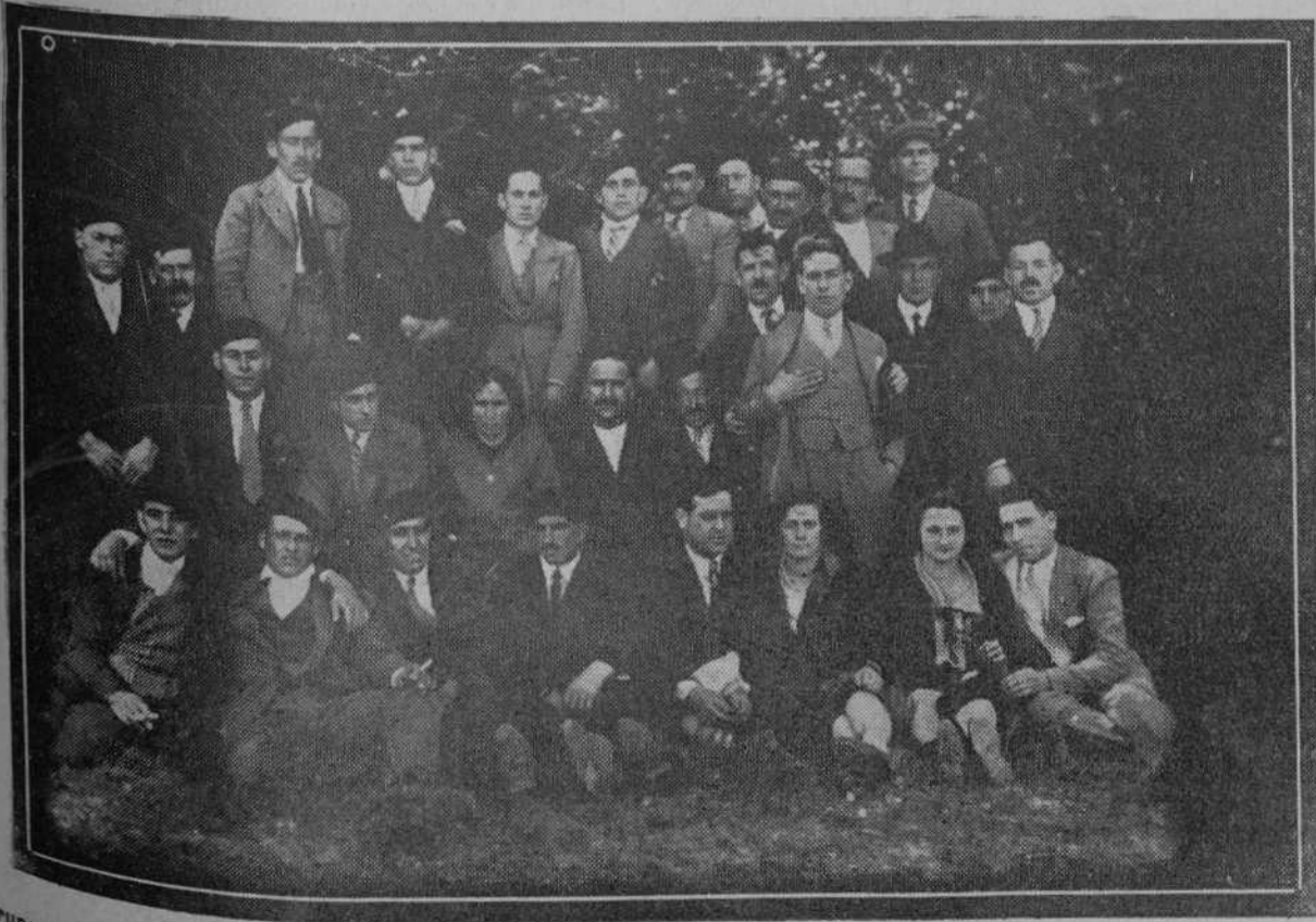
Grupo de obreros del Sindicato Metalúrgico, de Reinos, que el domingo hicieron una visita al Sanatorio Marítimo de Pedrosa.