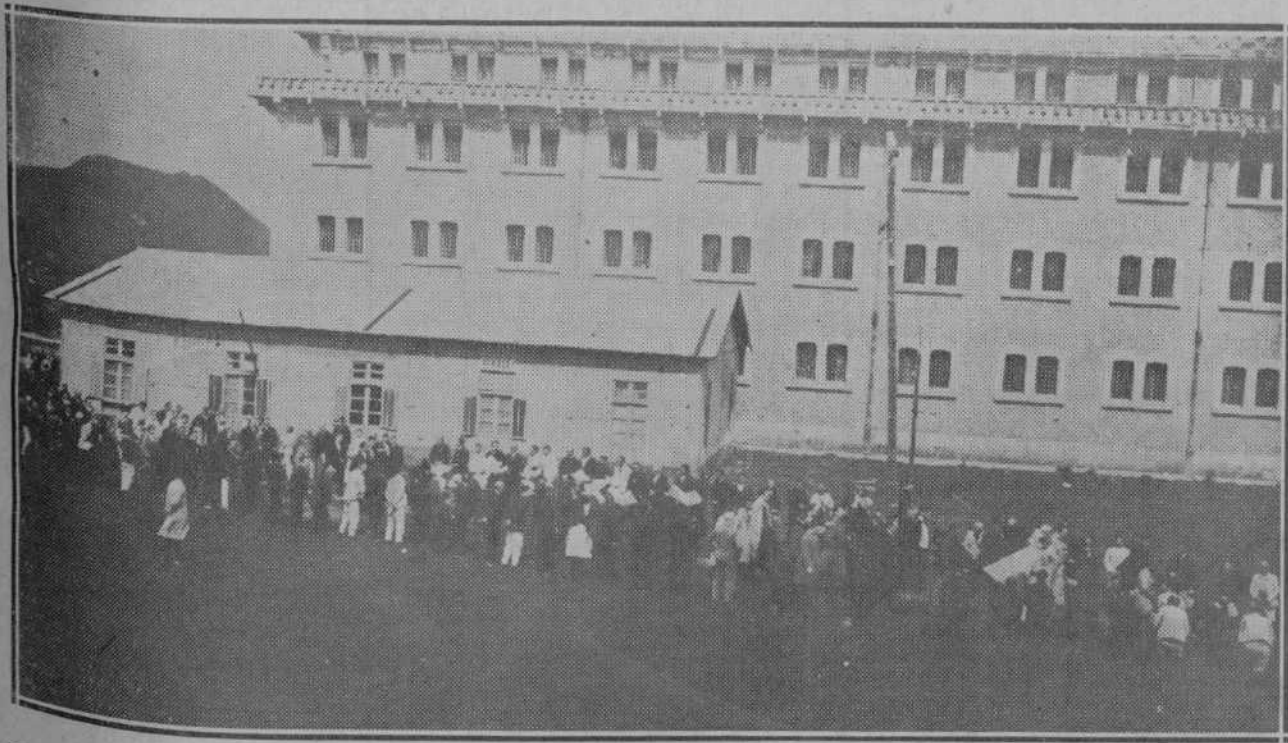
EL SOLEMNE ACTO DEL DOMINGO EN LA COLONIA DEL DUESO.—La procesión del Santísimo cuando se dirigía desde el Período a la Capilla.