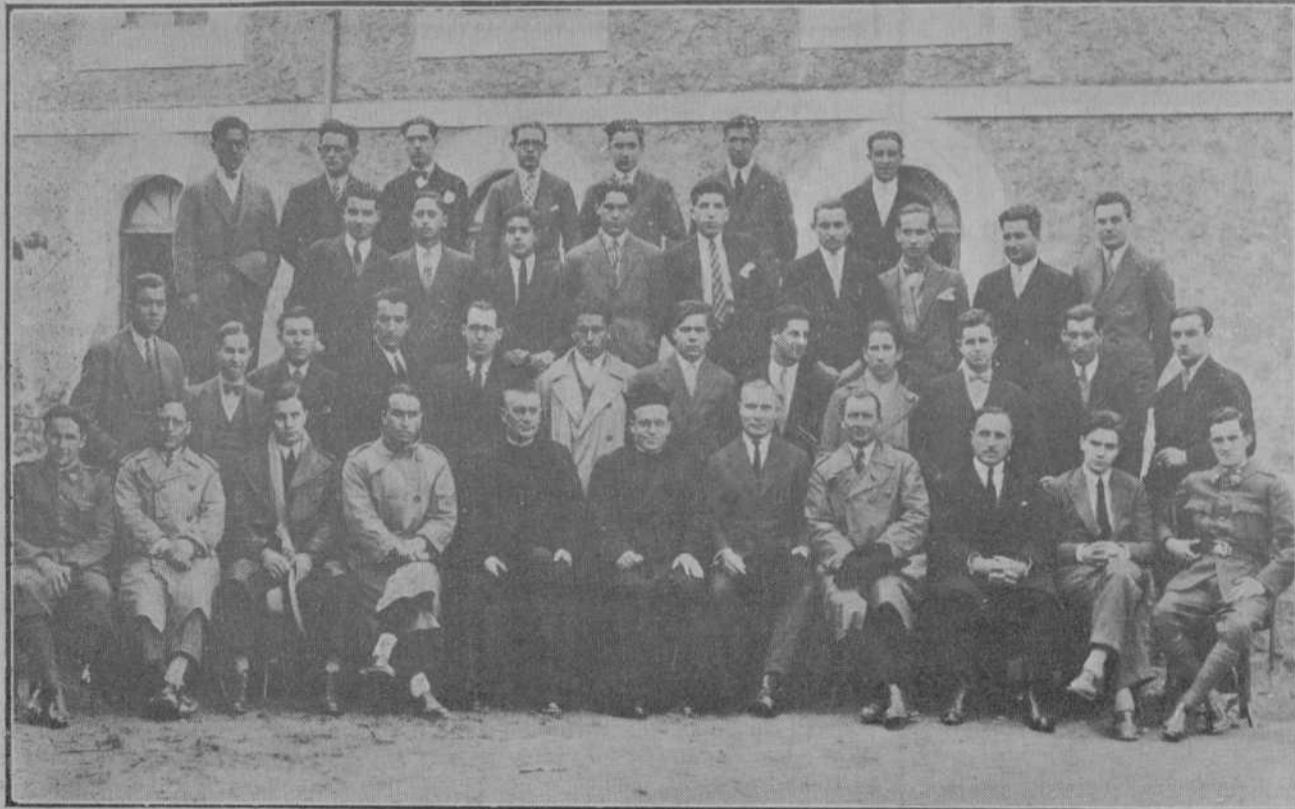
LIMPIAS.—Grupo de concurrentes a la simpática fiesta celebrada el domingo en el Colegio de San Vicente de Paúl.

Como habíamos anunciado, ayer celebró la Comunidad de San Vicente de Paúl la fiesta de su excelso Patrono, aprovechando este día para reunir en fraternal abrazo a los antiguos alumnos que en diferentes cursos habían terminado aquí sus estudios. Así, desde bien temprano empezaron a llegar, unos de Bilbao, otros de Santander, y algunos de varios pueblos de la provincia, formando próximamente un ciento el número de ex alumnos que nos honraron con su visita.