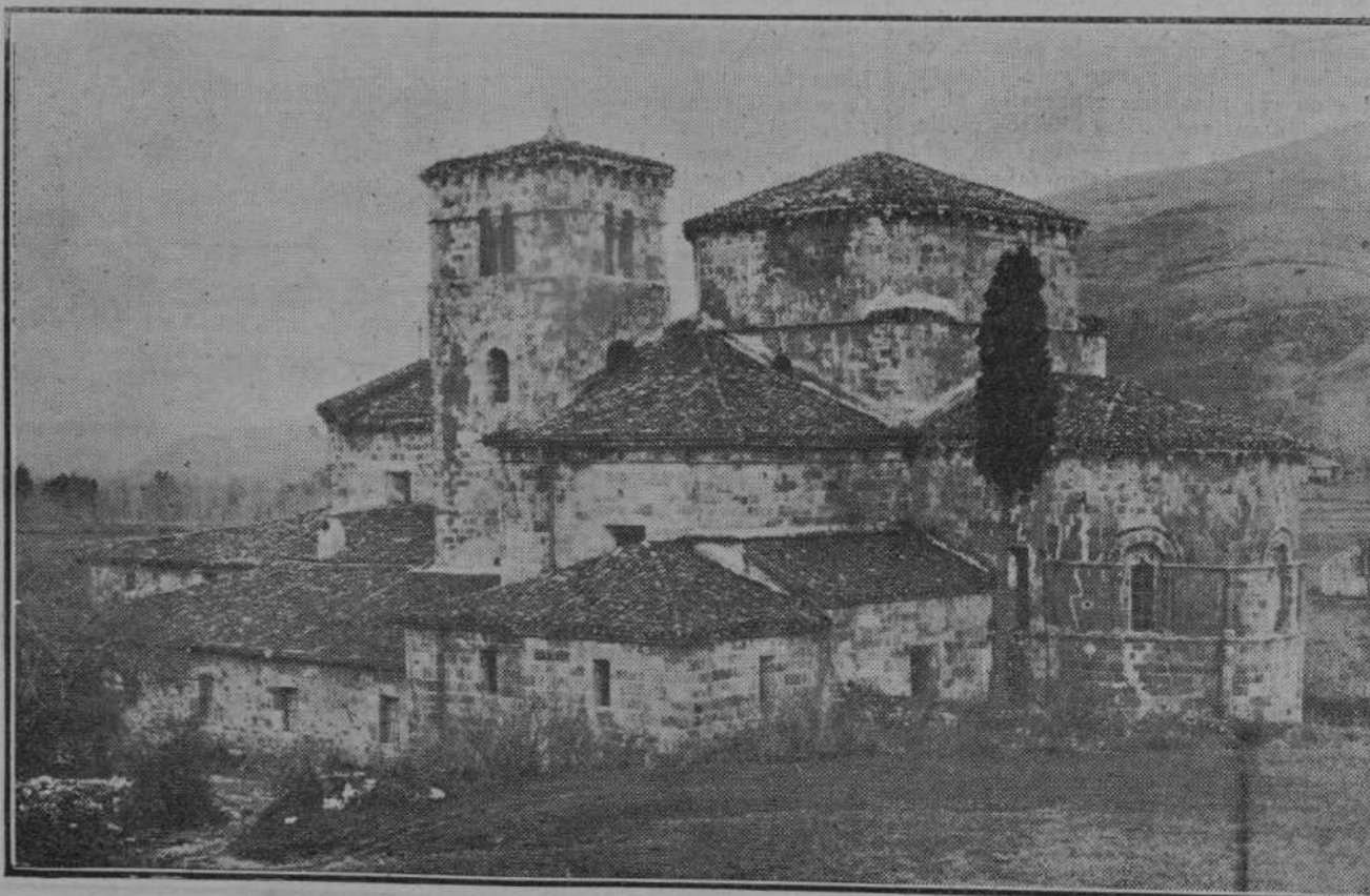
LA ADMIRABLE COLEGIATA DE CASTAÑEDA.