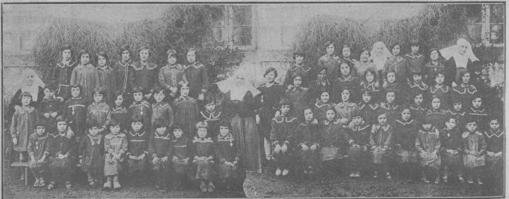
ALUMNAS Y PROFESORAS DEL COLEGIO ASILO DE JESUS, DE REINOSA.

Aun cuando en breve se publicará la Real orden de concentración de los reclutas del segundo llamamiento del reemplazo de 1927, se hace saber que el sorteo para Africa se celebrará el día 11 de marzo próximo, debiendo tener lugar la concentración del cupo de Africa en la última decena de dicho mes y el cupo de la Península los días 16 y 17 de abril.