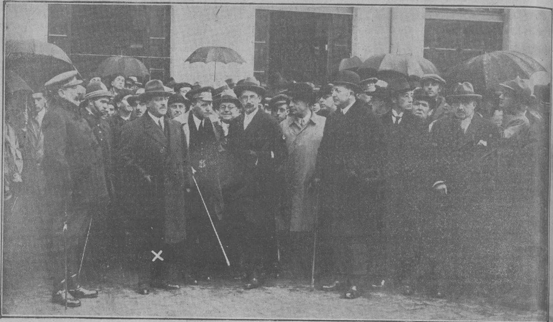
El vicepresidente del Consejo, general Martínez Anido (X), al llegar ayer mañana a Santander.