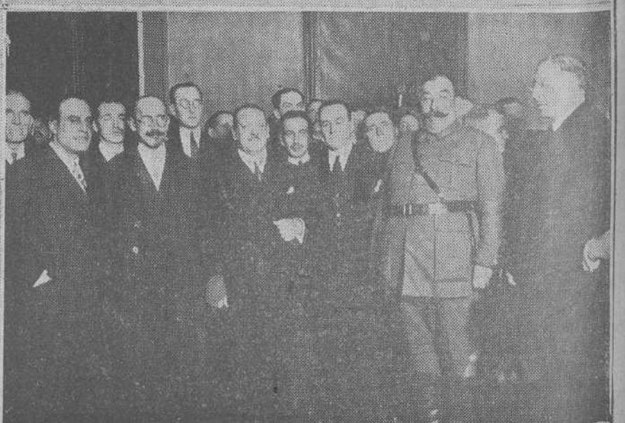
Alrededores de la estación del Norte momentos antes de llegar el ministro de la Gobernación.—Una representación de las cigarreras santanderinas, que acudió a Valdecilla.—Las pescaderas estuvieron también representadas...—El general Martínez Anido, con las autoridades, durante la recepción de la tarde.