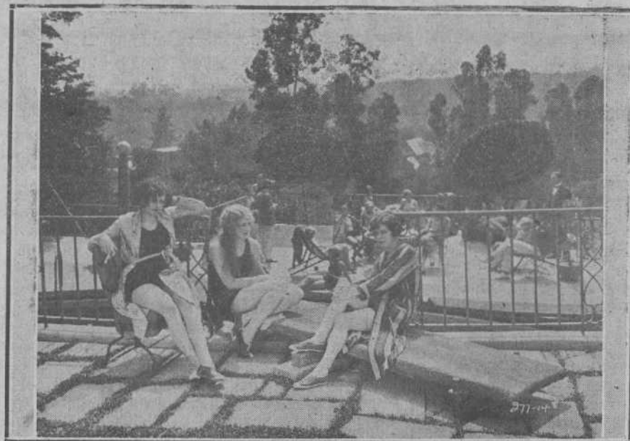
He aquí, en realidad, una escena de la película "La marca de fuego". Pero, ¿verdad que más bien parece la marca, registrada y todo, de la frescura.

La famosa artista recapacitó mucho sobre el caso de sus también famosos rizos, y acudió a la única guía