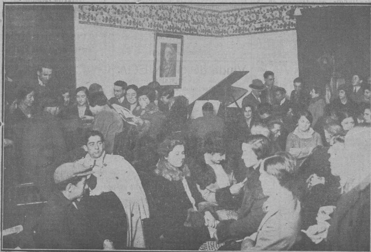
EN EL ATENEO POPULAR.—Todas las tardes se forman en el salón animadas tertulias.