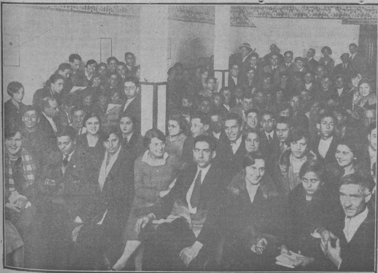
EN EL ATENEO POPULAR.—Escuchando una conferencia. (Véase nuestra información en la vigésima plana.