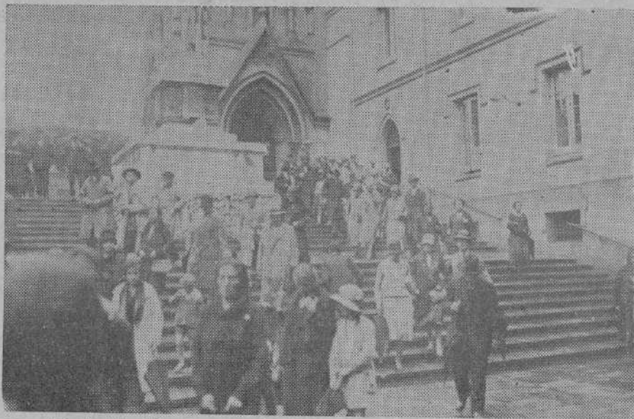
El desfile dura un cuarto de hora escaleras abajo...

Después de la bendición ya el sol se cuele por las puertas y las ventanas en un loco y magnífico raudal de luz. Una golondrina pasa como una flecha sobre el campanario cortando el espacio con su pico.