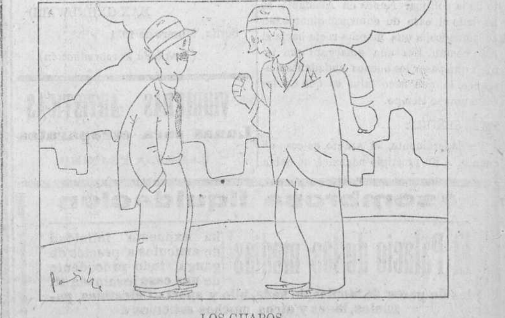
LOS GUAPOS —Y entonces abandonamos el café y salimos desafiados a la calle. —Menudo jaleo se armaría. —Qué hombre. Nos volvimos al café porque eran las doce de la noche y no pasaba un alma que nos viera.

Roma.—El rey de España ha enviado el siguiente telegrama al papa con motivo del aniversario de la coronación: «Al conmemorar en este día la coronación de Vuestra Beatitud, me complace en enviarle, Beatísimo Padre, con mis felicitaciones más sinceras y de la reina, la expresión de los fervientes votos que formamos por su dicha. Una vez más, contando con su benevolencia, solicito, Beatísimo Padre, su especial bendición para mi amada patria y nosotros todos. Reiterándole seguridades de reverente y filial afecto, Alfonso.»