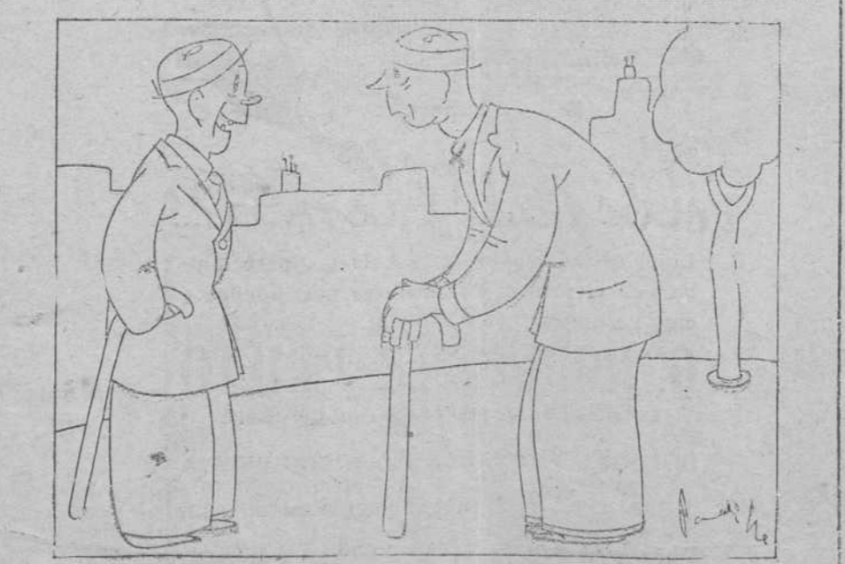
—¡Caramba, don Melanio, le encuentro a usted más bajo de estatura. —Eso acaban de decirme en casa y en el círculo... Y la verdad, no sé a qué atribuirlo. Como no sea que esta mañana me lavé los pies...