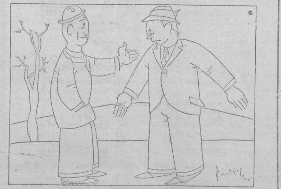
—¿Has estado mucho tiempo de vacaciones? —Mes y medio. Figúrate, ni tiempo siquiera para ensuciar la camisa.

Anoche llegó de Madrid en automóvil, el doctor Gregorio Marañón, acompañado de sus hijos. Se hospedó en el Gran Hotel del Sardinero. El doctor Marañón, salió esta mañana a las diez para San Sebastián.