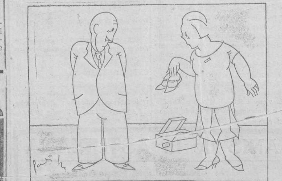
—Dice mi señorita que la suela está bien, pero que la piel es muy mala. —Dile a tu señorita que me está matando a disgustos y que me va a costar la piel.

El señor García, don Eleofredo, dió por terminado el acto, refiriendo una maniobra, por la cual se quiso enfrentar a la minoría republicana, con una fuerza de opinión.