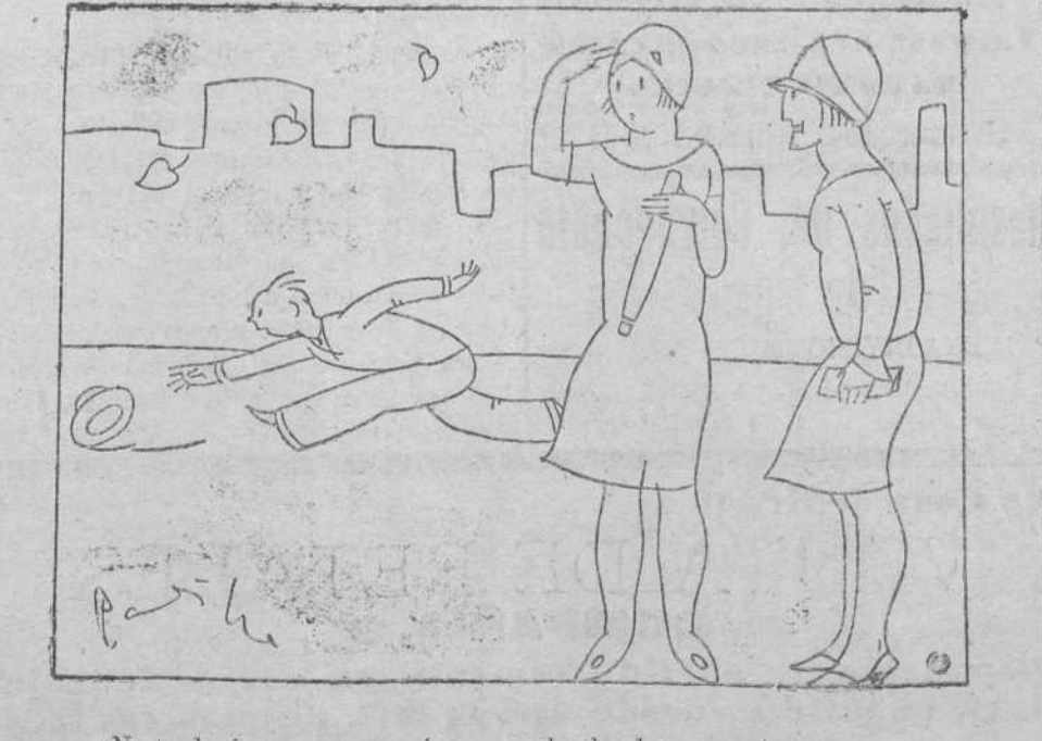
—¿No te decía yo que parecía un muchacho de carrera!