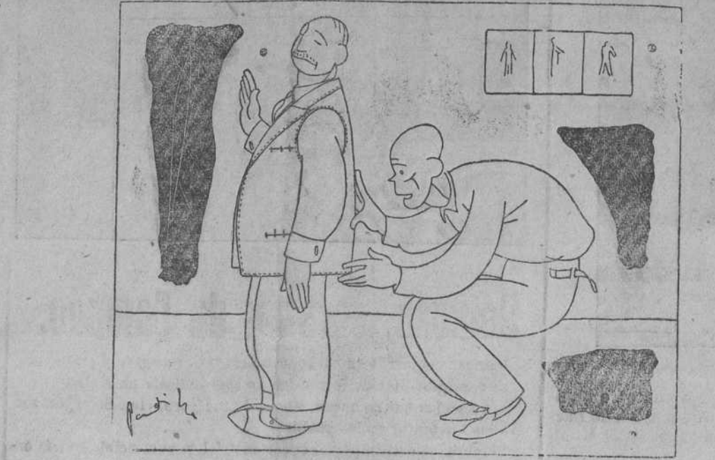
—Bueno. ¿Y en cuanto me vendrá a salir este traje? —Unas cuatrocientas pesetas. —Entonces no me ponga bolsillos; porque no me van a hacer falta.