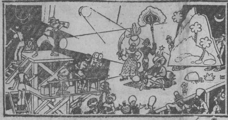
—¡Oye tu, Smit, échame esa montaña un poco a la izquierda y haz que la luna haga brillar los collares de la bailarina.

El registro matricial de los arbitrios sobre «Rótulos, toldos y anuncios de todas clases» y el de «Paso de toda clase de vehículos por aceras y andenes» serán formalizados durante el presente mes. Los que figurando en la matrícula del pasado ejercicio hayan dejado de poseer el rótulo, toldo, anuncio o vehículo motivo de la imposición, deberá producir antes de fin del mes presente la correspondiente baja; y los que, por haber adquirido la obligación de contribuir la correspondiente alta. Santander, 17 de abril de 1929.—El alcalde, Fernando Barreda.