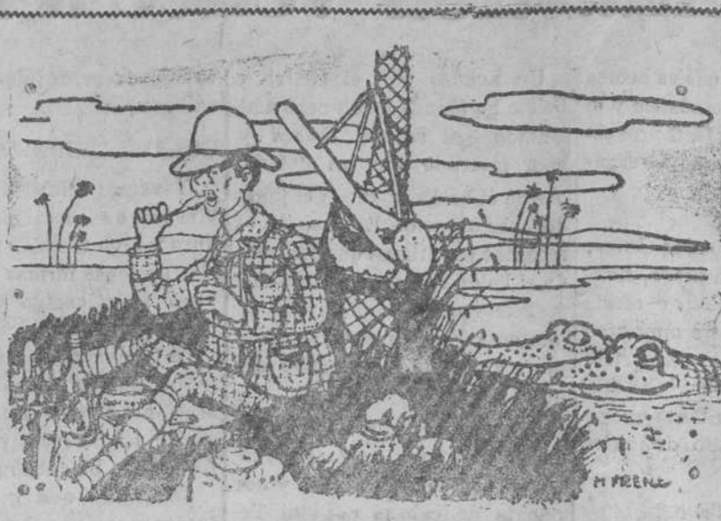
El cocodrilo.—Espérate! que acabe y así nos lo comemos todo de una vez.

San Francisco, 31 (Preme a la iglesia del mismo nombre)