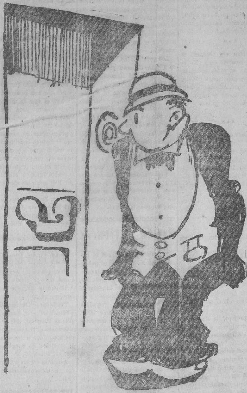
Pues señor, ¡si que estoy en un aprieto! Si no entro en casa, no puedo comer y me moriré de hambre, y si entro me mata la parienta a escobazos.

Ha desaparecido el régimen de nieblas del Mediterráneo. En la península Ibérica no son de esperar cambios importantes en 24 horas.