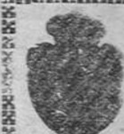
Castro de la Oca Casa

Blanca, 11.—SANTANDER Teléf. 31-10 Casa en GIJON Corrida, 42