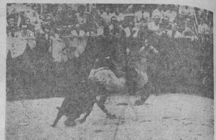
Conchita Linares poniendo un refón.