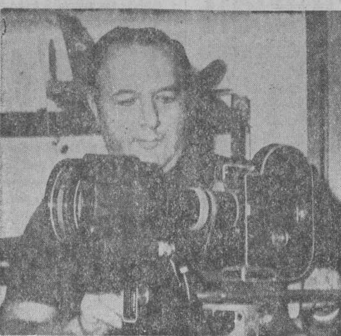
Don Juan de la Cierva intervendrá hoy en el Curso de Problemas Contemporáneos.

Hemos de ir a una disminución de los medios de suplencia (internados) y fortalecer a la familia.