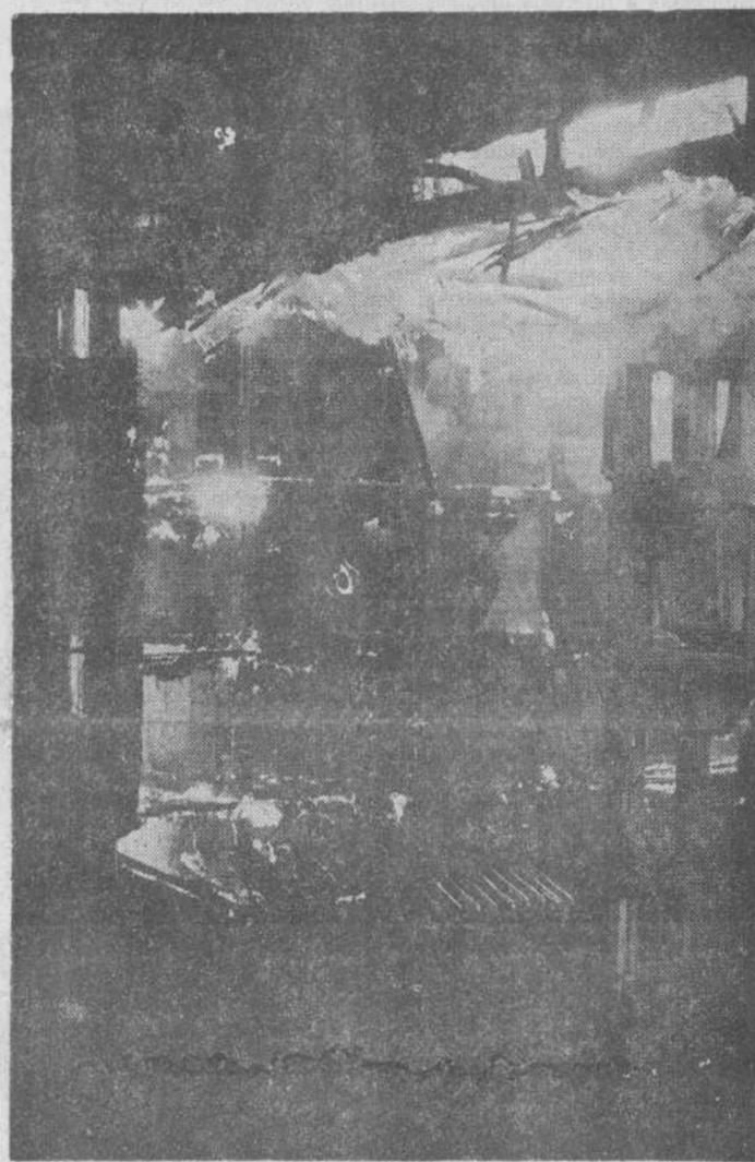
A las pocas horas de iniciarse el siniestro del antiguo Palacio de Macho, no quedaba más que un inmenso brasero.

al ser el siniestro en el centro de la ciudad, a los pocos momentos de haberse declarado puede decirse que miles de santanderinos permanecían como mudos espectadores, viendo el dantesco espectáculo que proporcionaban las llamas.