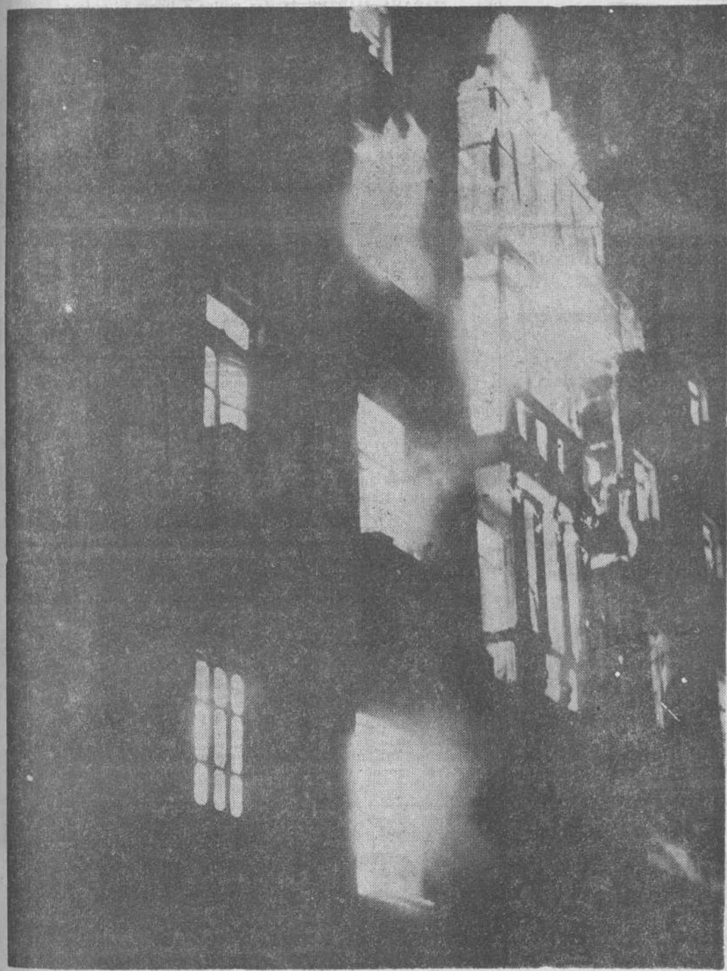
El edificio de la calle de Hernán Cortés, durante el pavoroso incendio de ayer tarde. Las llamas prendieron en el interior y salían por balcones y ventanas, hasta quedar destruidos el comercio y oficinas de la firma Lainz y las cuatro plantas.

MILES DE PERSONAS PRESENCIARON EL FUEGO, QUE HA OCASIONADO PERDIDAS APROXIMADAS DE 150 MILLONES