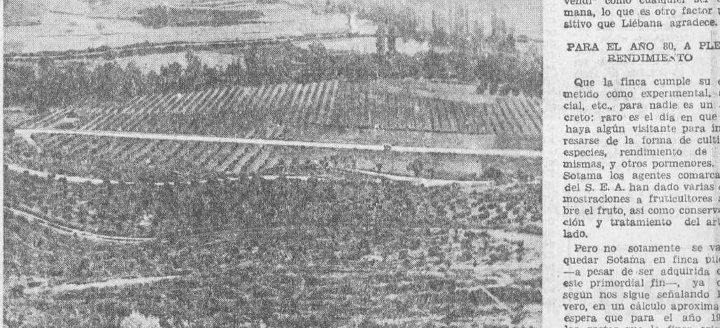
Vista parcial de la finca Sotama, de la Diputación Provincial, en Lieñana.