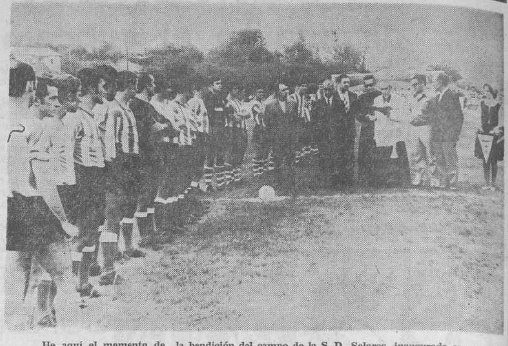
He aquí el momento de la bendición del campo de la S. D. Solares, inaugurado ayer.

At. de Bilbao: Iribar; Sáez, Belita, Amarguen; Larrauri, Ibañeta; Ortuzo, Uriarte, Arieta, Rojo II y Rojo I.