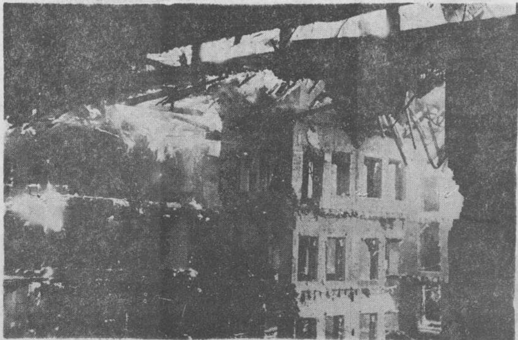
Este era el aspecto de los restos calcinados que anoche quedaban en pie, de lo que fue el Palacio de Macho.

También resultaron ligeramente lesionados algunos de los hombres de la Guardia Civil, que junto con la Policía Armada y Policía Municipal trabajaron de forma destacada en el mantenimiento del orden, tarea un tanto difícil, puesto que