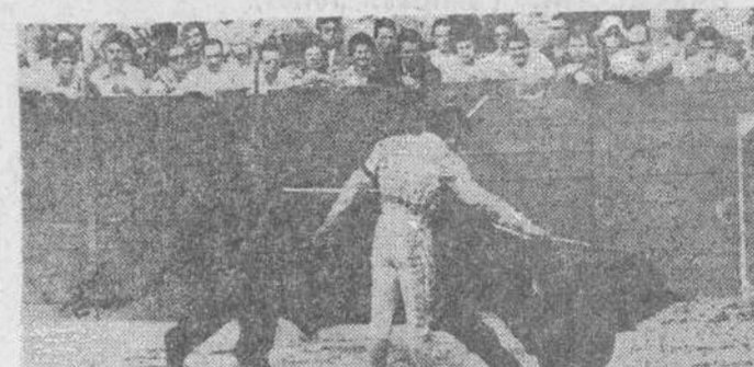
«El Norteño», en un derechazo.