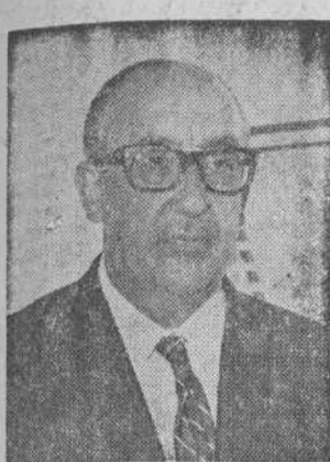
El ilustre periodista y novelista don Alvaro Cunquero

Alvaro Cunquero disertará en el Curso de Novela y Teatro de «LA REFORMA DE LA EMPRESA»