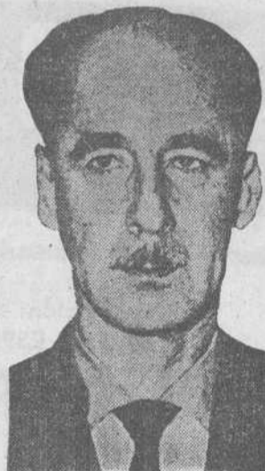
El presidente de Bolivia, general Ovando Candía.

Mientras aviones de combate sobrevuelan La Paz, sin que resulte clara la posición que han adoptado quienes los pilotan, una guerra de comu-