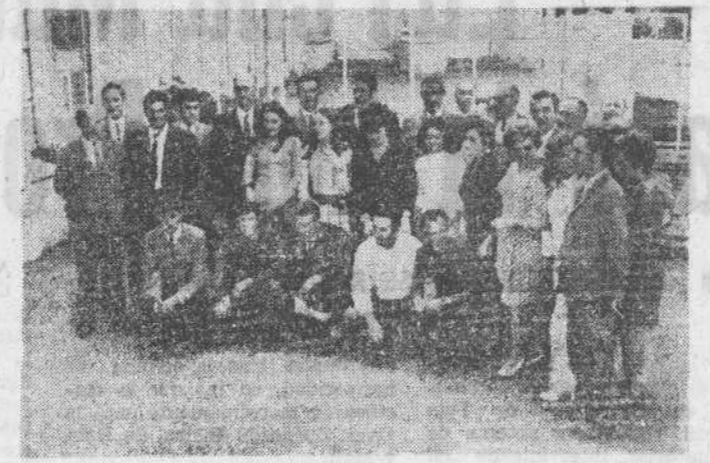
Ayer, patronos y dependientes del comercio textil celebraron la fiesta de su patrono, San Francisco de Asís. Hubo una misa en la parroquia de San Roque y comida de hermandad en el Casino, asistiendo también varias jerarquías sindicales. En la foto, un grupo de asistentes.