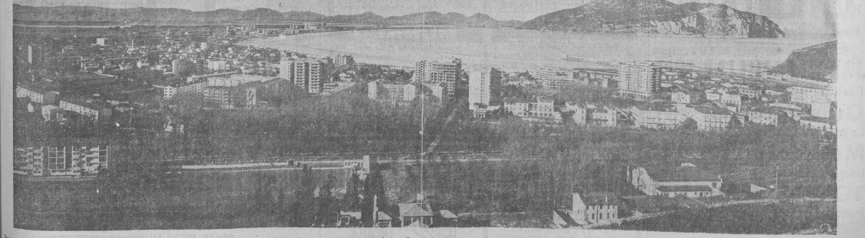
registra en ninguna otra de nuestras zonas turísticas. He aquí una panorámica, con su inmensa playa, de la bellísima villa montañesa.—(INFORMACION EN LAS PAGINAS QUINTA, SEXTA, SEPTIMA Y OCTAVA)