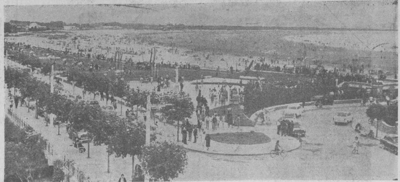
Luz, sol, mar y frondoso arbolado, ofrece esta perspectiva de uno de los lugares más bellos de Laredo.

Y después de esto, después de presenciar este auténtico derroche de buen gusto, de sana alegría, en competición por presentar la