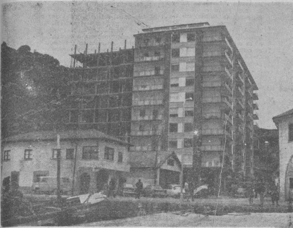
Vista del bloque de viviendas construido en el puerto de Laredo

Venta de apartamentos Facilidades de pago