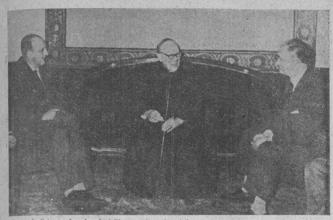
El excelentísimo señor don José Elorza, gobernador civil y jefe provincial del Movimiento, y el obispo de Santander, don José Eguino, con el prelado de la diócesis, doctor Eguino y Trece, al que visitaron para felicitarle en su fiesta onomástica.—Foto ARAUNA (hijo).