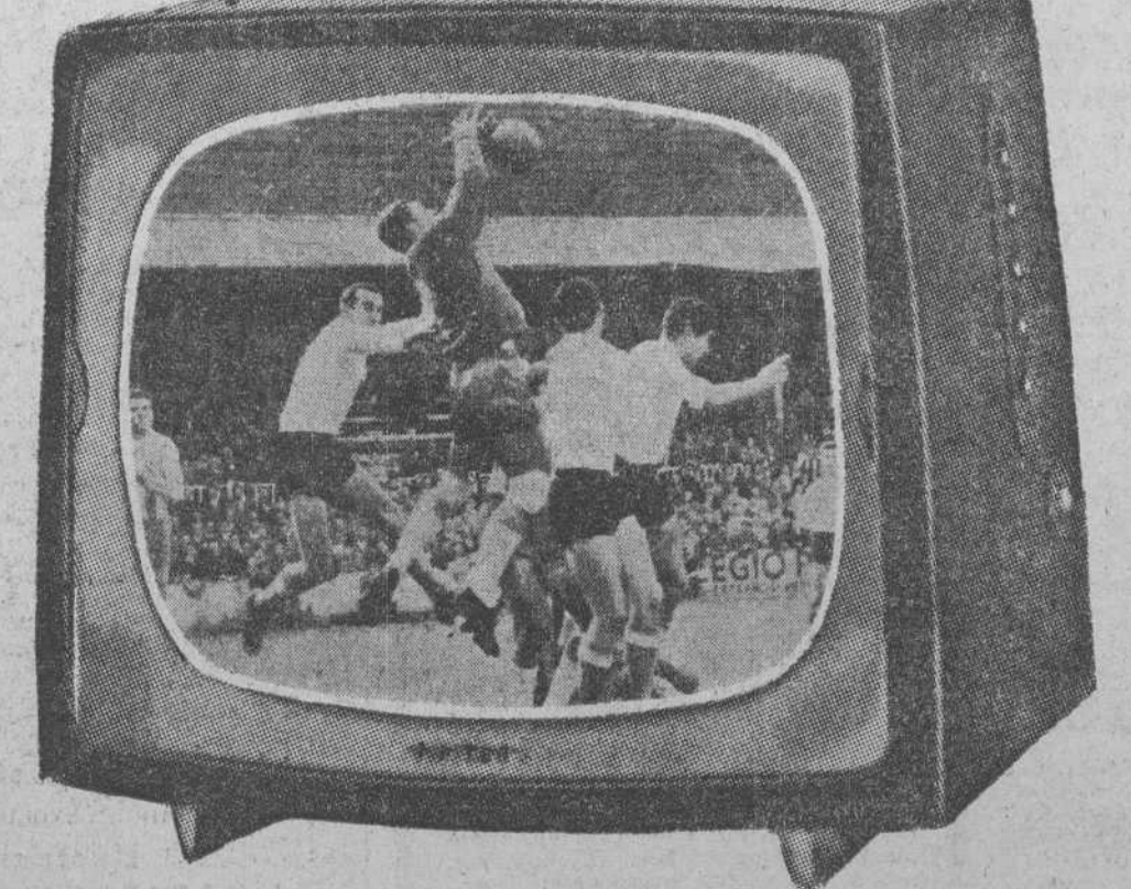
A la salida de un córner sacado por Yosu, el portero catalán bloquea la pelota rodando de rinquinistas que tratan de adelantarse.