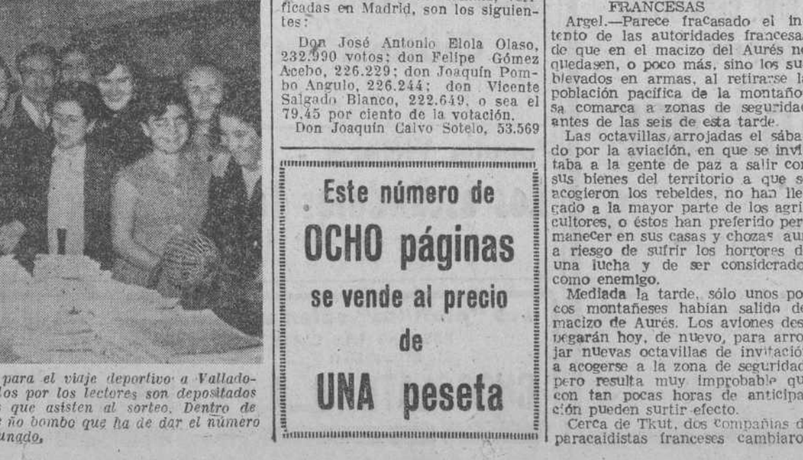
Trámite previo de nuestro sorteo para el viaje deportivo a Valladolid. Los miles de cupones enviados por los lectores son depositados y revisados ante los concursantes que asisten al sorteo. Dentro de unos minutos funcionará el pequeño bombo que ha de dar el número afortunado.