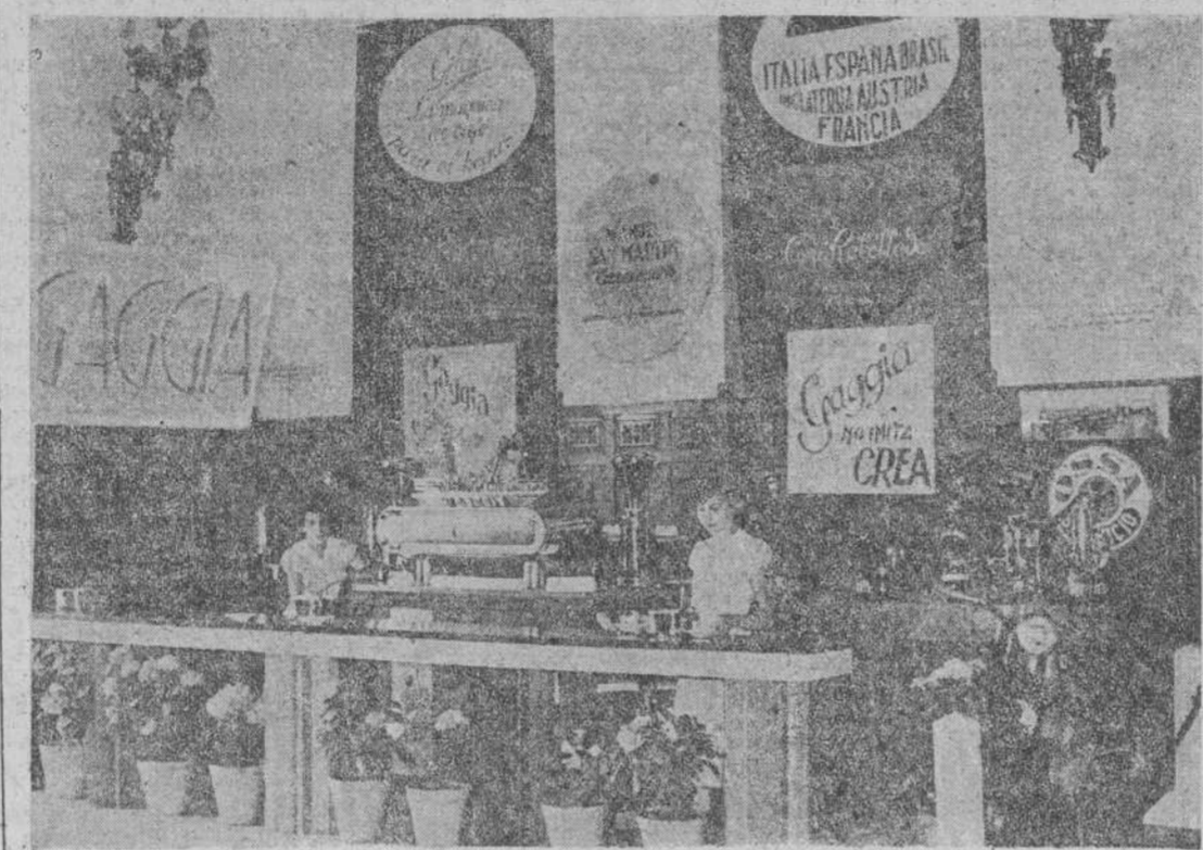
El stand de "GAGGIA" ha constituido una de las mayores atracciones de la Feria, con sus degustaciones de café a la italiana. "GAGGIA" es la máquina más vendida e imitada.