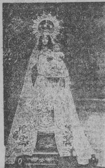
NUESTRA SEÑORA LA VIRGEN DEL CAMPO