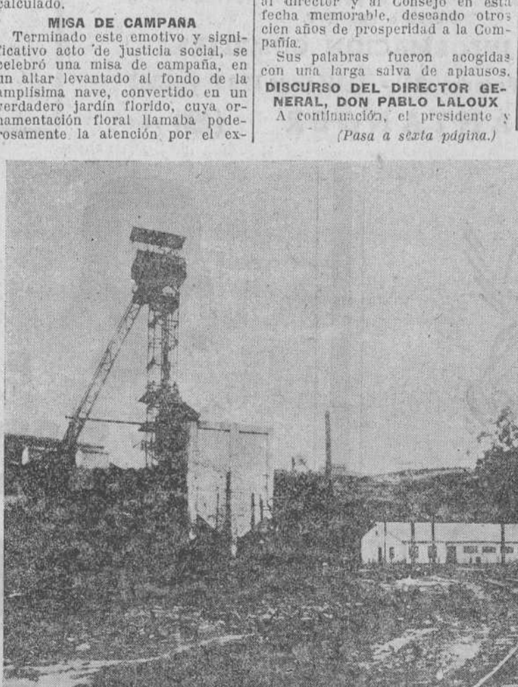
Castilleja y toiva en la boca del pozo de "Santa Amalia".