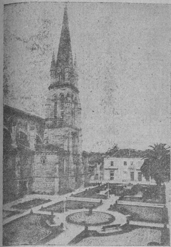
El magnífico santuario de la devoción torrelaveguense, cuyas Bodas de Oro se solemnizan con una emocionada ofrenda de flores.

Santuario de la Virgen Grande, Ciudad Satélite y Grupos escolares figuran entre los proyectos de la actual Corporación