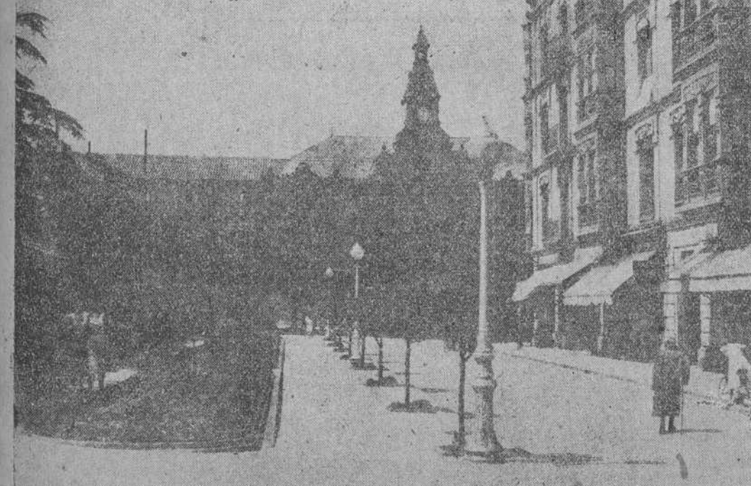
Proverbial es el interés que demuestra el actual Municipio por el aspecto urbanístico de la ciudad.