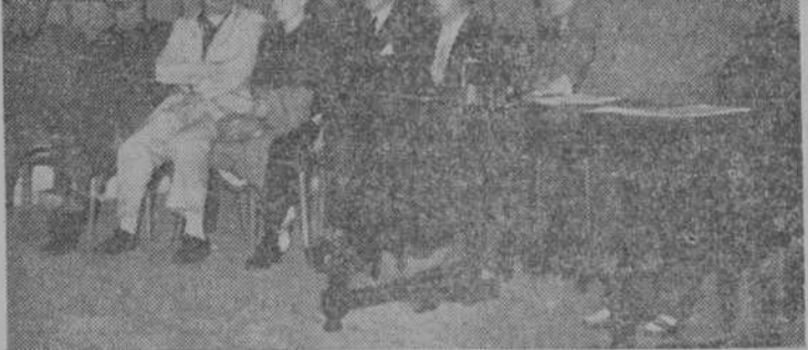
El gobernador civil dirigiendo la palabra a los asambleístas.

Y porque es así y los hombres de la Falange así lo entienden, es por lo que estas Asambleas, que tienden a terminar con la improvisación de los veinte años pasados, para encausar la acción en sólidos programas, han encontrado en todas las comarcas el ambiente más halagüeño. En Ciudad Rodrigo, centenares de asambleístas se congregaron y no precisamente para hacer simple acto de presencia, sino para intervenir en forma eficiente y entusiasta en las Comisiones de trabajo como en los plenos en la elaboración de unas conclusiones tendentes a esos fines que se persiguen.